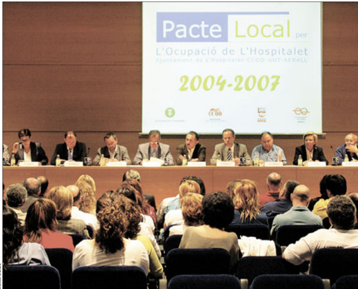
Sindicats, empresaris i Ajuntament signen el Pacte a l'Auditori de La Farga

En aquesta mateixa línia s'ha pronunciat el secretari general de la Unió Comarcal de la UGT a L'H,