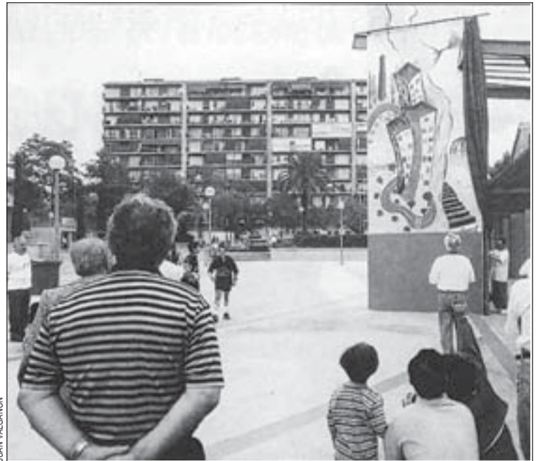
El mural se convertirá en un símbolo del barrio