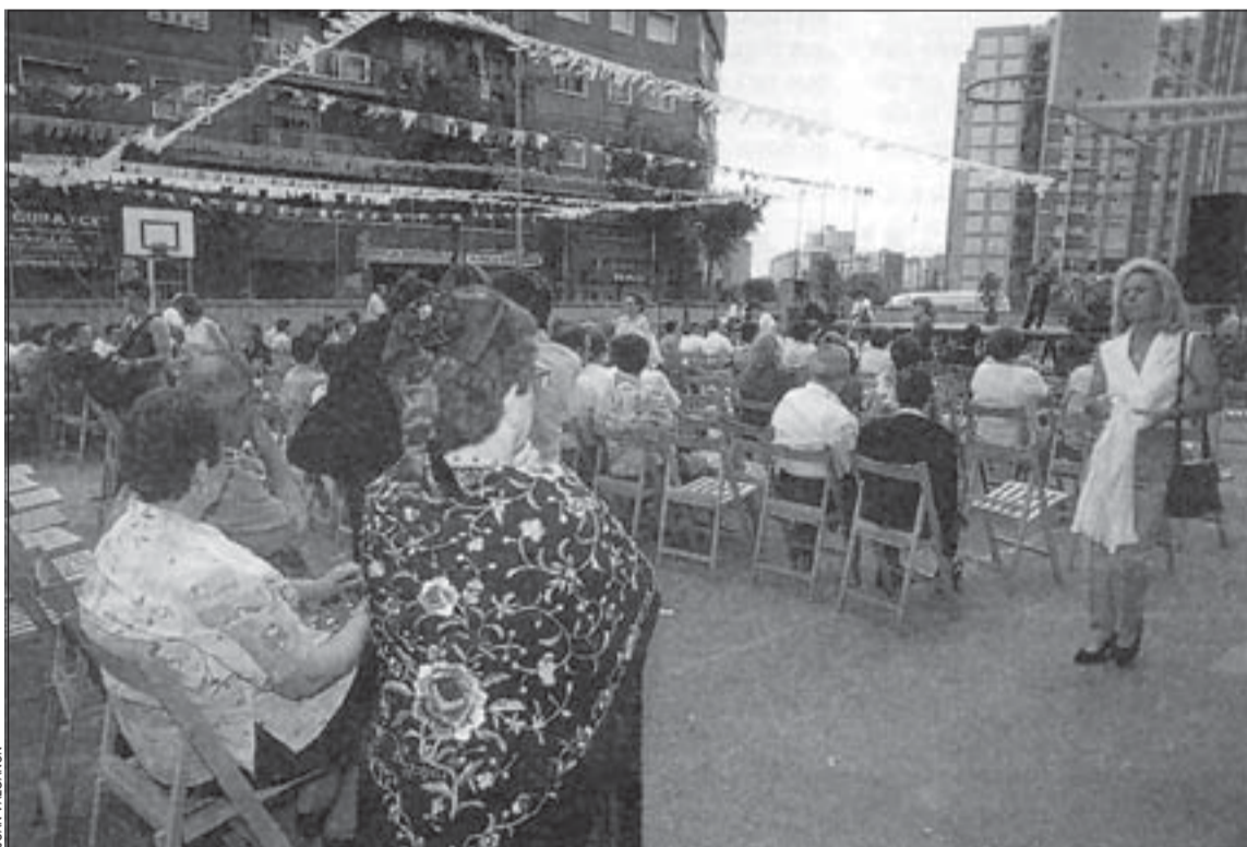
Las dos entidades organizaron una fiesta para celebrar la inauguración de sus nuevos locales