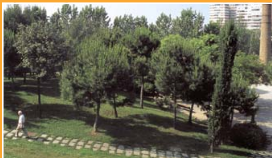
El parque metropolitano de Les Planes es uno de los de mayor superficie de la ciudad

El parque de la Torrassa está pendiente de ampliación, un proyecto ligado a la llegada del AVE