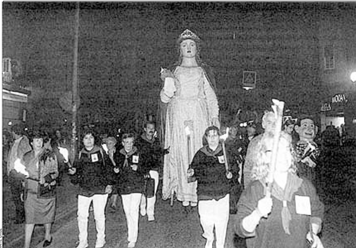
El pasacalles con gigantes y cabezudos estará presente un año más en las fiestas de Sant Josep

Para los amantes de los deportes, la comisión de fiestas ha convocado las 12 horas de fútbol sala que se desarrollarán de 8 a 20h en el centro público Pau Sans. La Agrupación Lola Anglada ha preparado juegos infantiles y una gimcana que tendrá entretenidos a los más pequeños de once de la mañana a las dos de la tarde. A las 11h se abrirá una exposición de manualidades organizada por