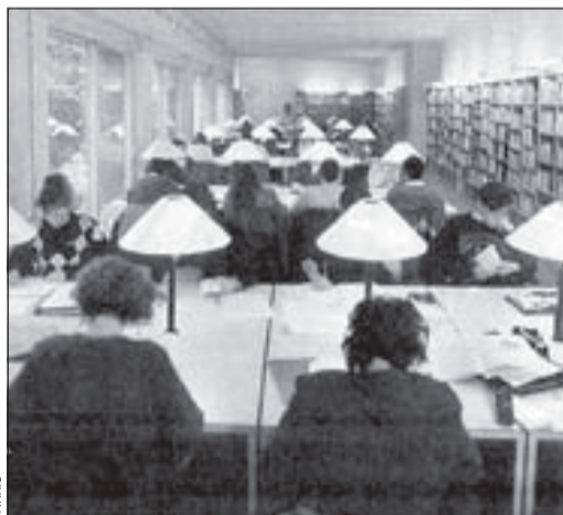
La red de bibliotecas de L'H se verá ampliada

La Biblioteca de la Bòbila, por su parte, llegará a un barrio, Pubilla Casas, infradotado de equipamientos culturales. La biblioteca paliará esta situación dinamizando la lectura, prestando servi-