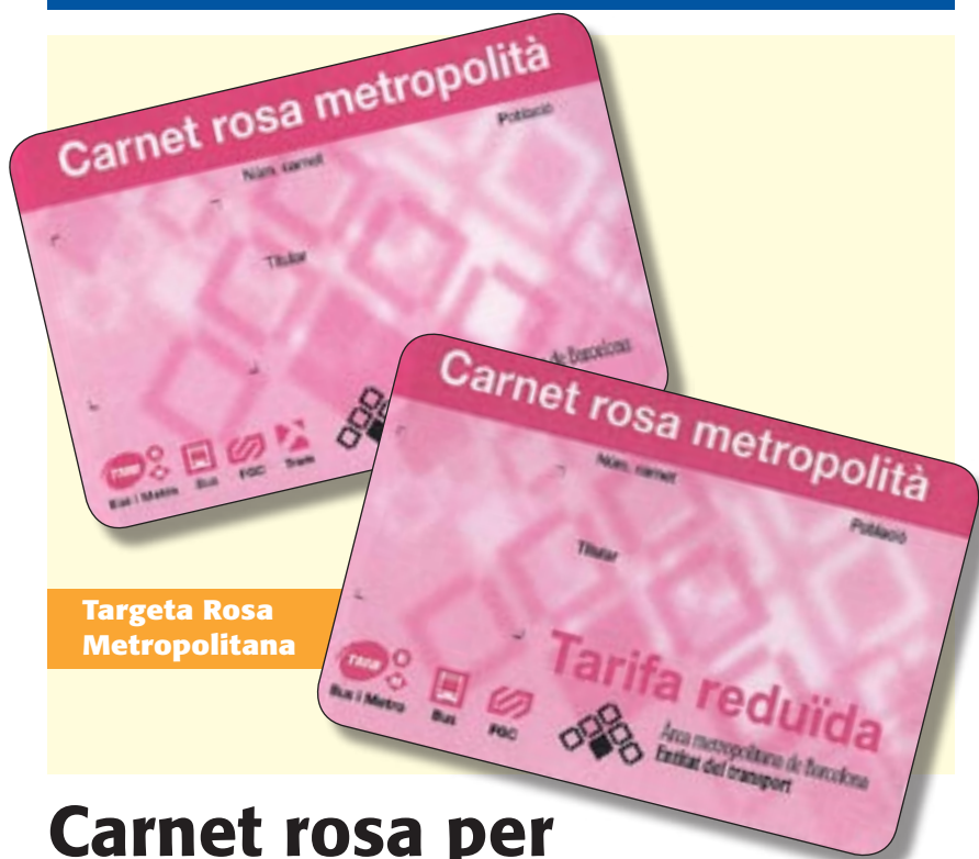
Targeta Rosa Metropolitana