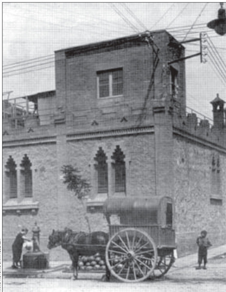
Venda ambulat de melons davant la fàbrica tèxtil Can Trinxet i enderroc de l'església de Santa Eulàlia de Merida a l'agost de 1936

El manual d'història s'emmarca dins el programa Conèixer L'Hospitalet que l'entitat completarà en els pròxims mesos amb una campanya de difusió de la base de dades d'estudis locals Babel'H —un servei d'informació i assessorament on es pot trobar tota la documentació publicada sobre la ciutat— i amb la presentació, el