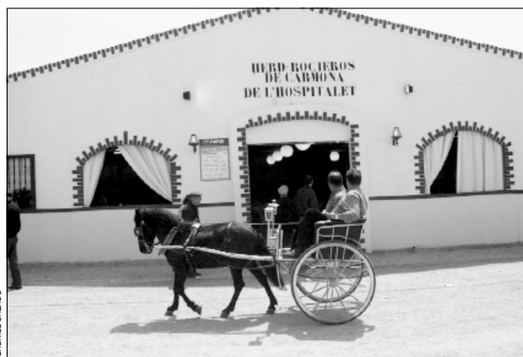
Rocieros de Carmona vuelve a la Feria de Abril

La Hermandad Rocieros de Cardona instalará su caseta en la Feria de Abril que se celebrará del 26 de abril al 5 de mayo en la playa de la Mar Bella. Asimismo, la Asociación de comerciantes del Torrent Gornal también organiza su Feria de Abril en la av. Ponent el día 20 a las 18h con sevillanas, manzanilla, cerveza y pica pica.