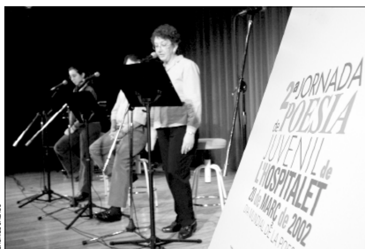
La poesía juvenil se dio cita en el Barradas

La Associació d'Estudiants organizó el pasado 20 de marzo las II Jornadas de Poesía Juvenil de L'H con motivo del Día Internacional de la Poesía. Las jornadas contaron con la colaboración del colectivo Verba y de la cantautora Silvia Comés. Los jóvenes tuvieron la oportunidad de mostrar sus cualidades poéticas.