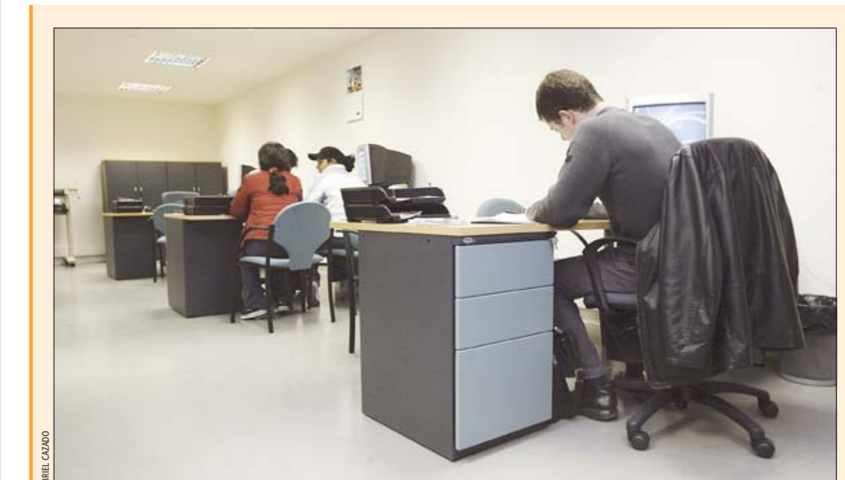
Oficina de vivienda en la plaza Espanyola de Collblanc-la Torrassa