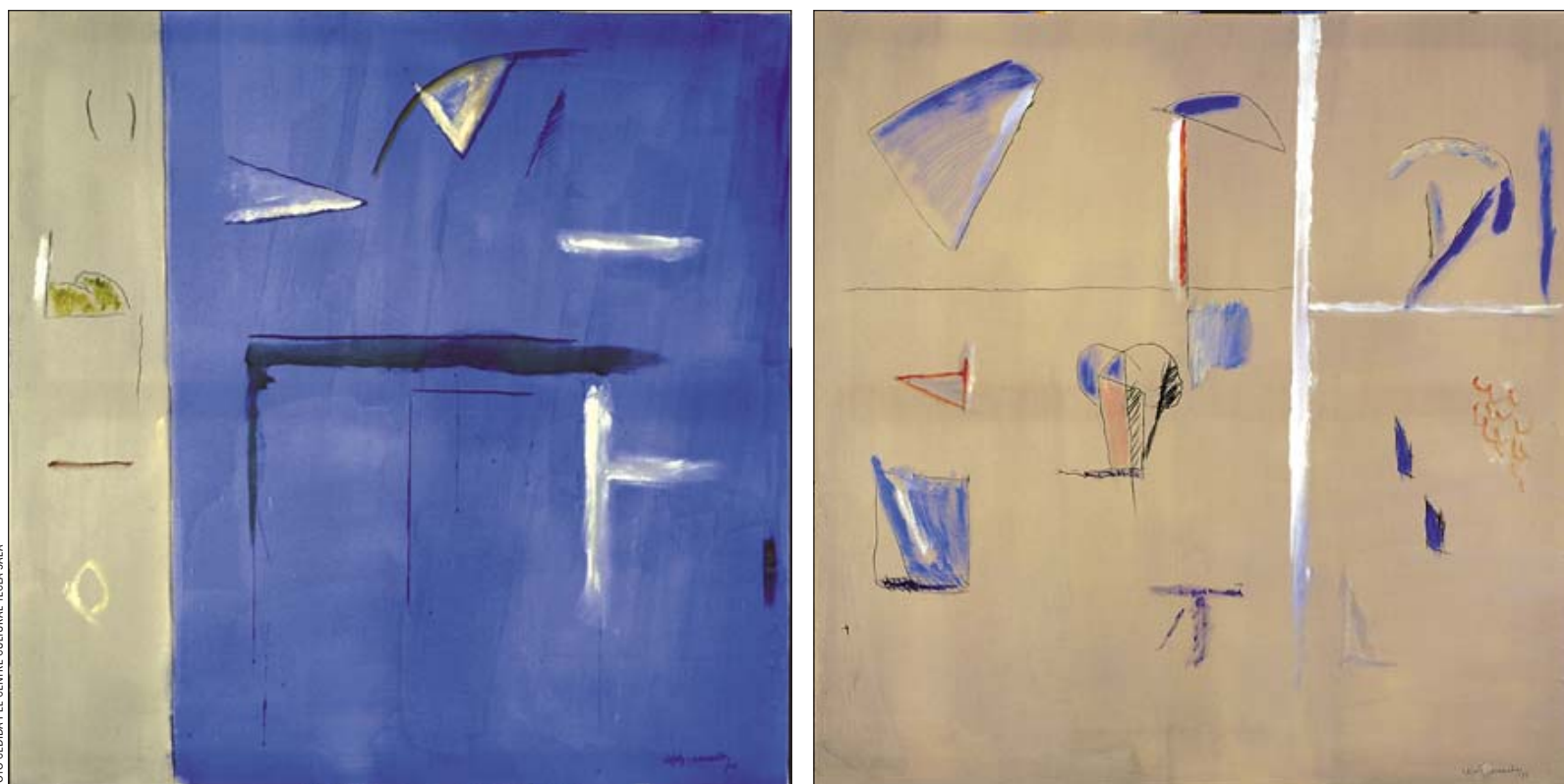
Angle verd, Jardí gris i Llums d'estiu (a baix), tres dels quadres de l'artista català