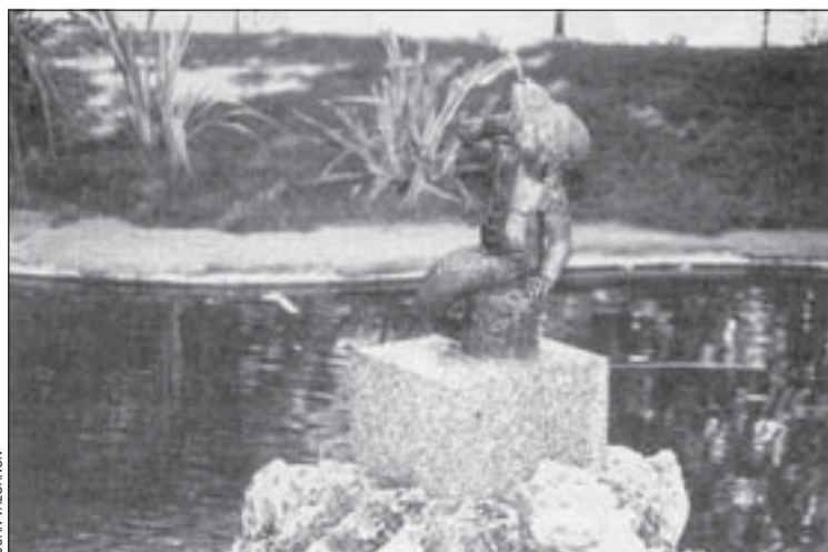
A dalt, la nova imatge de la Moreneta , i a baix, la Sirena