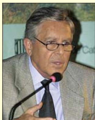
Carlos Jiménez Villarejo Jurista

El Gobierno debe afrontar un estricto régimen de incompatibilidades de alcaldes y concejales que los aleje de cualquier actividad inmobiliaria