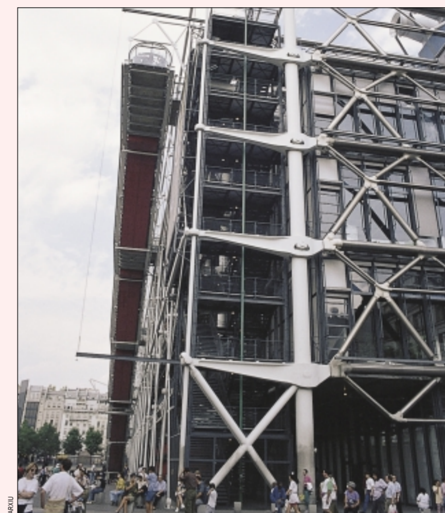
El centro George Pompidou de París proyectado por Rogers

La trayectoria de este arquitecto británico le ha acreditado como el principal valor mundial de la arquitectura bioclimática. Su estudio se ha especializado en la construcción de edificios de bajo consumo energético y que regulan las emisiones nocivas, siguiendo las últimas tendencias de Estados Unidos que ha aplicado, por ejemplo, en el Parque BIT (Balears Innovació i Tecnologia) de Mallorca. Su trabajo ha hecho que el primer ministro británico, Tony Blair, le nombre asesor de Downing Street en cuestiones urbanísticas.