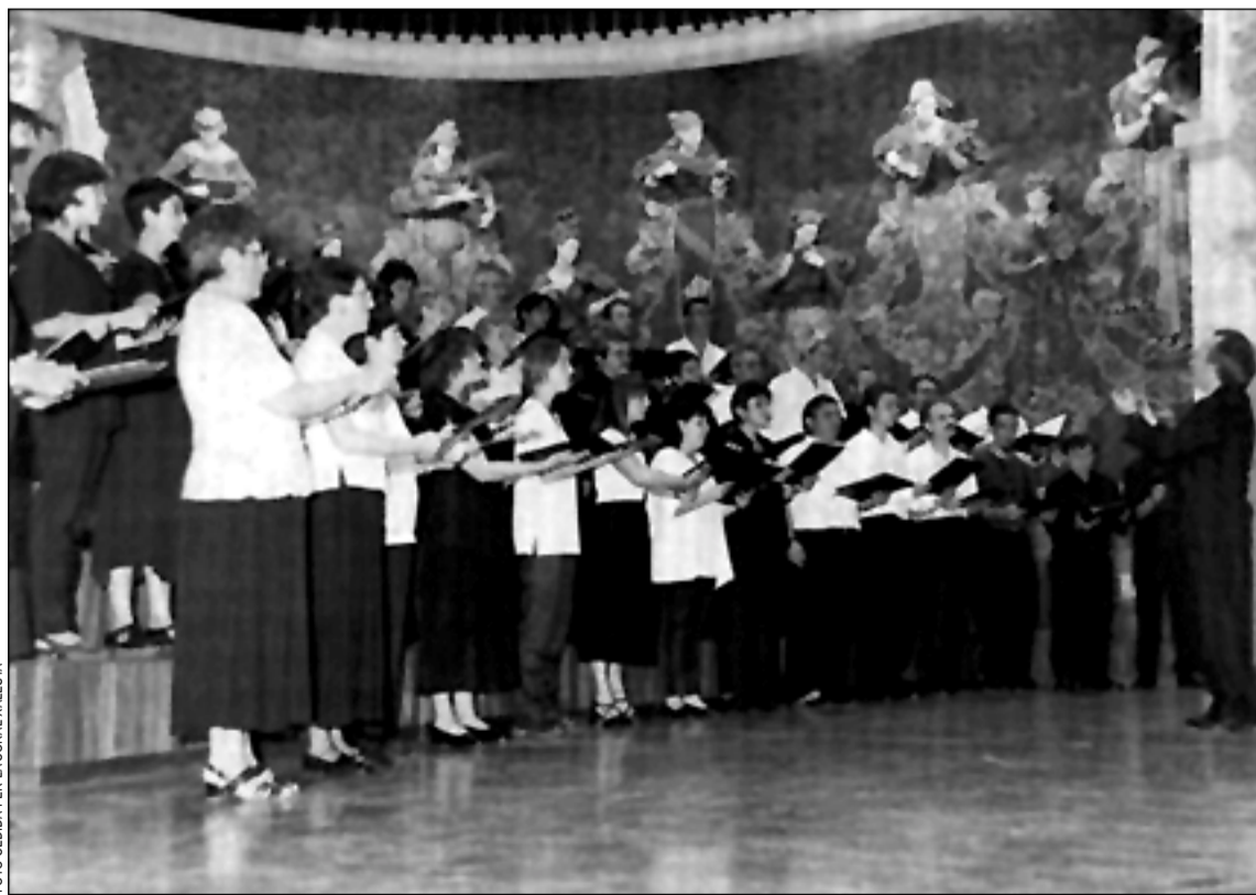
Els components de l'entitat en un concert al Palau de la Música el mes de setembre de 1998

Del cd-rom, que ha estat editat amb la col·laboració de l'Ajun-