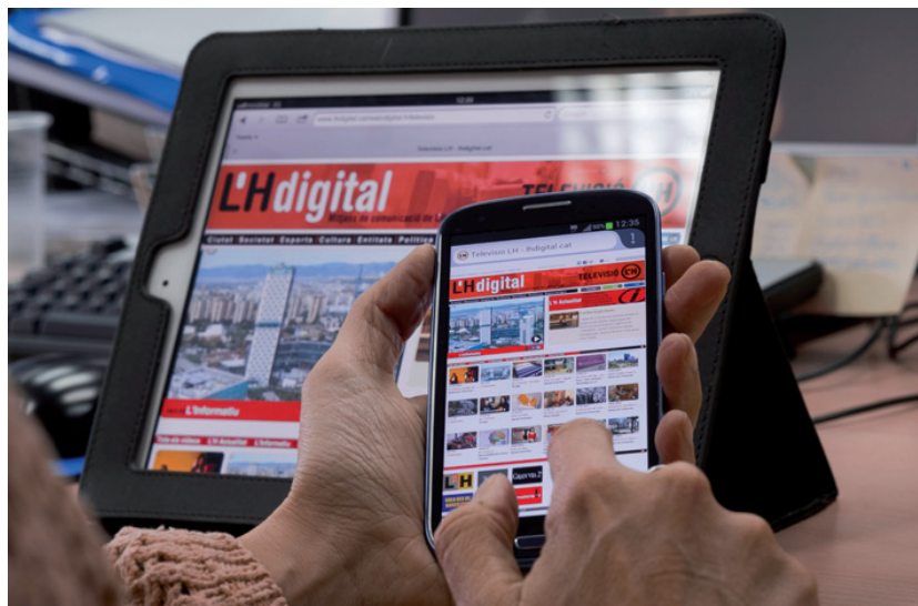
L'Hdigital estarà aviat adaptat a mòbils i tauletes

Tots els espais de Televisió de L'Hospitalet es poden consultar a la carta a L'Hdigital. En qualsevol moment, des de qualsevol lloc, a la pàgina de TV L'H es poden consultar els informatius; el reportatge