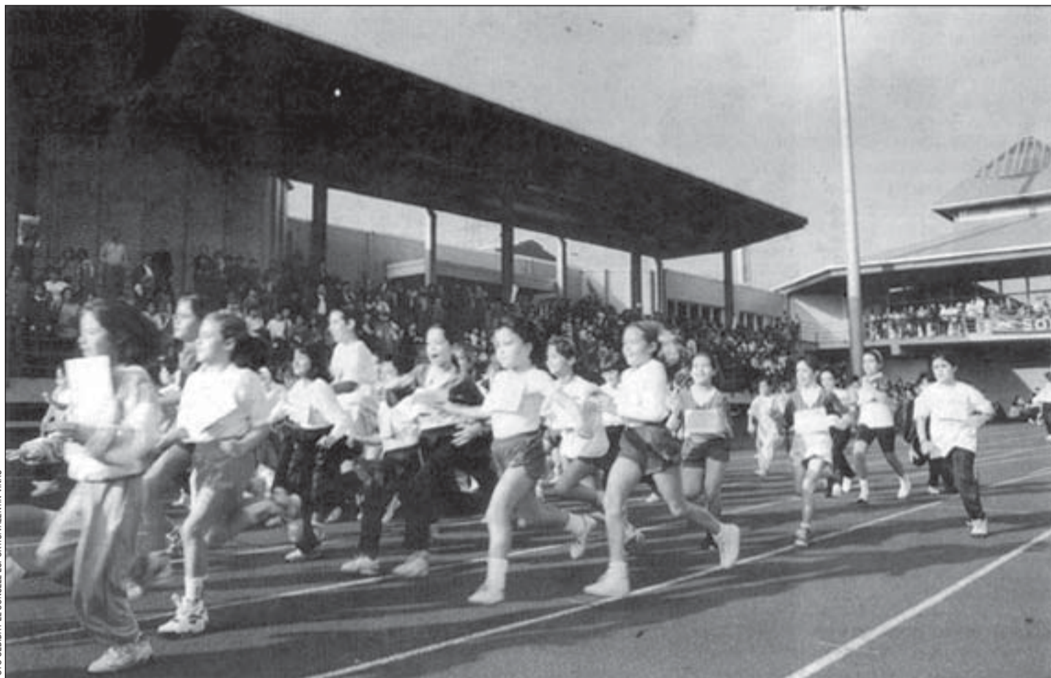
El cros és una de les activitats centrals dels Jocs Escolars cada curs

Aquest curs, es pot parlar d'un petit increment del nombre global de participants a les competicions dels Jocs a L'Hospitalet, després d'uns anys de tendència a la baixa per motius com el descens de la