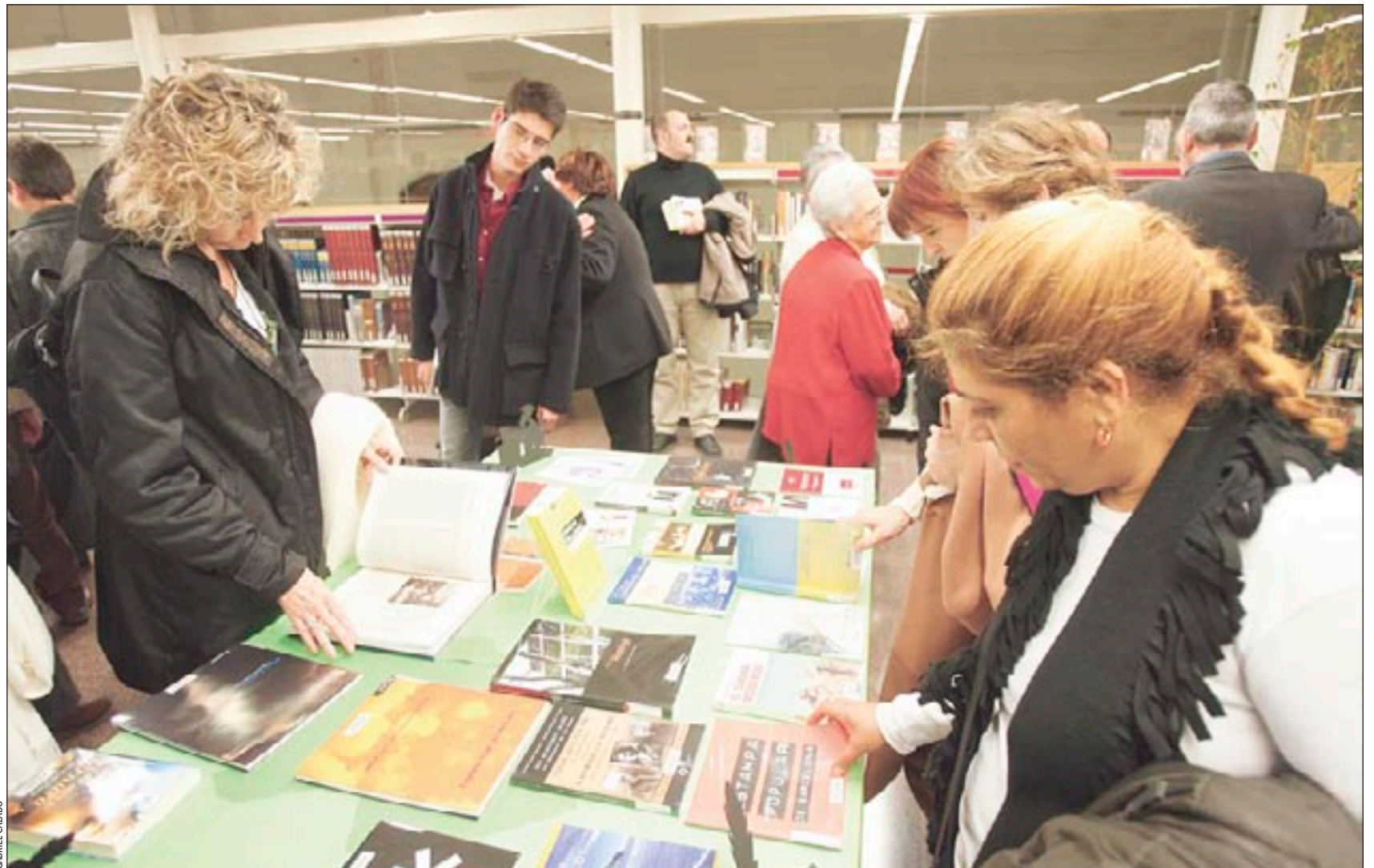
La Tecla Sala exposa els llibres publicats per autors hospitalencs durant el 2005-2006