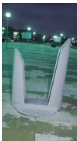
Nueva fuente adaptada

del Transporte ha puesto en circulación 12 nuevos autobuses urbanos, que a final de año serán 20, y que cuentan con un sistema que facilita el acceso a las personas con dificultades de movilidad. Por otra parte, en los últimos años la ciudad ha renovado y colocado 1.250 nuevos puntos de luz y, para reducir el consumo energético y la contaminación lumínica, se ha potenciado la instalación de luces de sodio y mercurio. En el apartado de la lim-