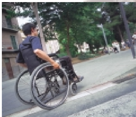
Unas aceras accesibles

Y puesto que una ciudad es más humana cuando el tráfico es más ordenado se ha puesto en marcha el Centro de Control de la calle Migdia. En este sentido, la Entidad Metropolitana