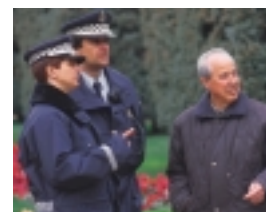
Una Guardia Urbana próxima

La comodidad va muy ligada con el entorno que nos rodea. En los dos últimos años, las campañas de control de humos y ruidos se han saldado con 200 controles de ruidos, 900 inspecciones en industrias además de los diferentes servicios que la unidad de calidad de vida de la Guardia Urbana efectúa diariamente.