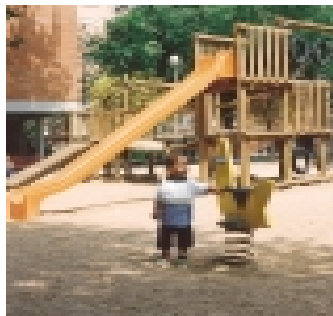
Juegos infantiles más divertidos

L'Hospitalet es cada día una ciudad más cómoda, más confortable. La renovación del mobiliario urbano, con la instalación de 1.000 bancos, 800 papeleras, 110 marquesinas de publicidad y nuevos juegos infantiles, ha contribuido de forma decisiva a que la ciudadanía disfrute de un medio urbano más agradable.