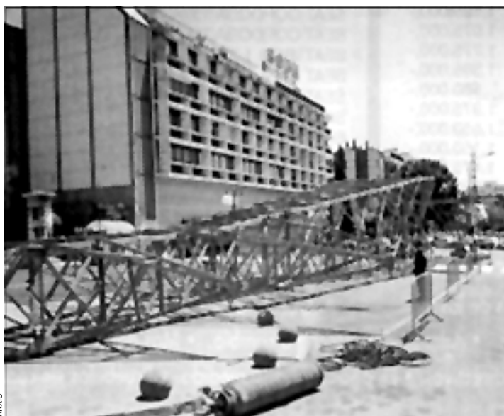
Las líneas eléctricas sometieron esta avenida al letargo

Primavera es una de las avenidas más amplias de la Florida, llamada a ser uno de los ejes del barrio, en una importante zona comercial junto al mercado. Sin embargo, la historia no le había hecho justicia hasta ahora. Durante años, gigantescas torres metálicas sostuvieron cables eléctricos de alta tensión en todo su recorrido, lo que impedía actuar sobre la avenida para convertirla en un espacio de uso ciudadano como ocurría en otras zonas de la Florida, Pubilla Casas o la Torrassa. Así, quedó limitada a dos vías para la circulación de vehículos y un gran paseo central sin urbanizar que ocupaban centenares de vehículos a diario.