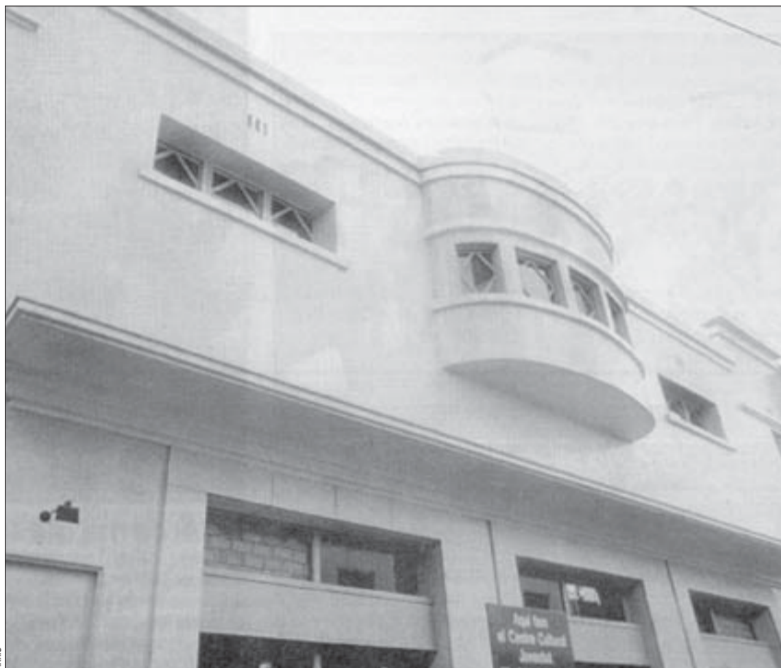
El teatro municipal, ubicado en la calle Joventut de Collblanc, abrirá la nueva temporada el día 20

mítico Macbeth centran la siguiente propuesta del teatro municipal. Catorce artistas intervienen en esta puesta en escena dirigida por Tamzin Townsend que fue uno de los platos fuertes del Grec'96. Además de entretener, esta obra persigue fines didácticos. Para ello, durante su presentación en la ciudad, del 15 de octubre al 10 de noviem-