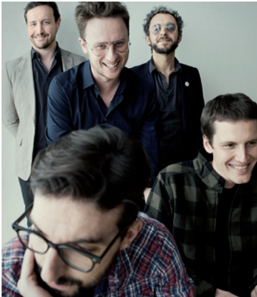
Mishima, una de les principals actuacions del Let's Festival d'enguany