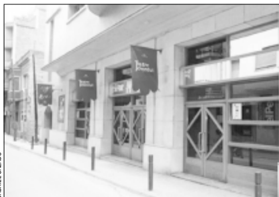
El Teatre Joventut, escenario del Grec 2001

El Grec metropolitano sólo comprende este año las poblaciones de Barcelona, L'Hospitalet, Santa Coloma y Badalona, fruto del acuerdo entre la Diputación de Barcelona y el Ayuntamiento de la Ciudad Con-