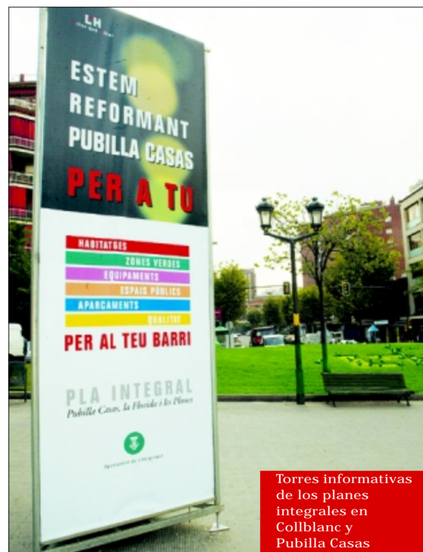
Torres informativas de los planes integrales en Collblanc y Pubilla Casas