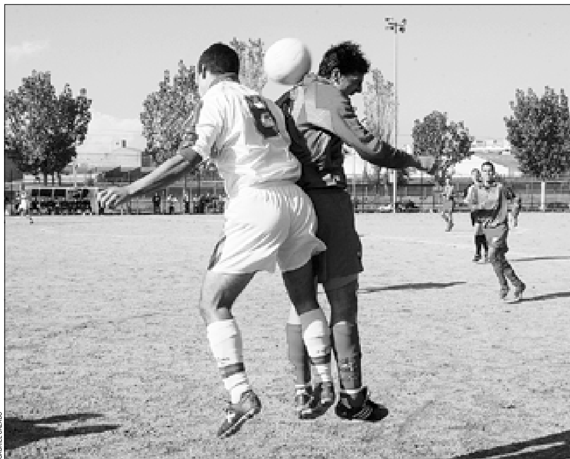
Partido de liga entre Gornal y La Florida, que es líder en Segunda Regional