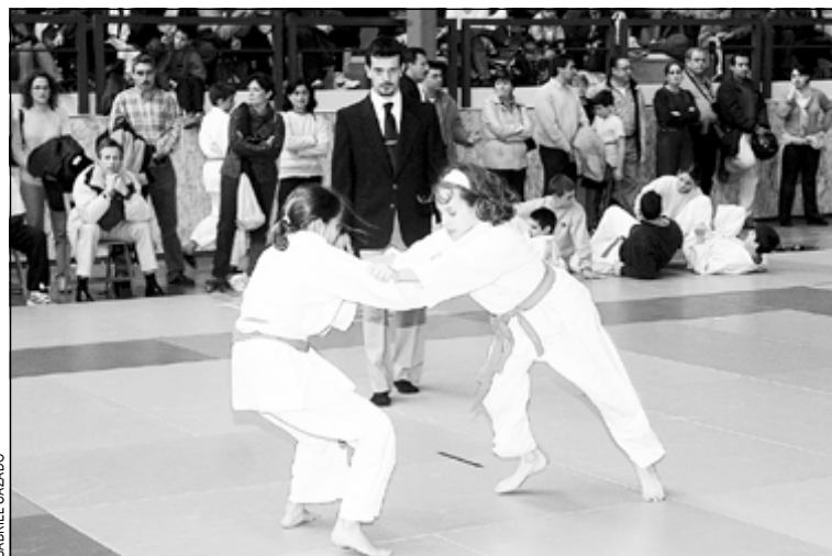
Imagen de una competición del torneo de 2001

ARTES MARCIALES El fin de semana del 30 de noviembre y 1 de diciembre se celebrará la decimosexta edición del torneo de judo 'Ciutat de L'Hospitalet' que cada año organiza la Agrupació Esportiva Santa Eulàlia. La jornada del sábado está reservada a la competición individual senior mientras que la del domingo se centra en la participación de las futuras estrellas de este deporte. Un año más, el club de nuestra ciudad ha hecho un gran esfuerzo para reunir un cartel de lujo. Entre las entidades invitadas destaca de nuevo la presencia del club francés del Sisteron. También competirán judocas de Perpiñán y de las federaciones andorrana, aragonesa y madrileña. Completarán la participación los judocas de los