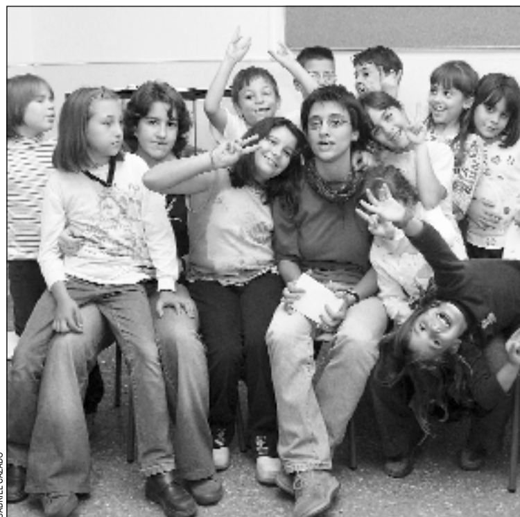
Els nens participen a les activitats organitzades per l'esplai

L'esplai Can Serra va començar a funcionar el 1971 vinculat a la parròquia del barri. En els seus inicis, les activitats que promovia estaven basades en el món de l'excursionisme i el treball en el temps lliure amb els fills dels immigrants que havien començat a arribar a L'H procedents d'altres punts de l'Estat espanyol a partir dels anys 60. Amb els anys, l'esplai ha anat obrint el seu ventall d'activitats.