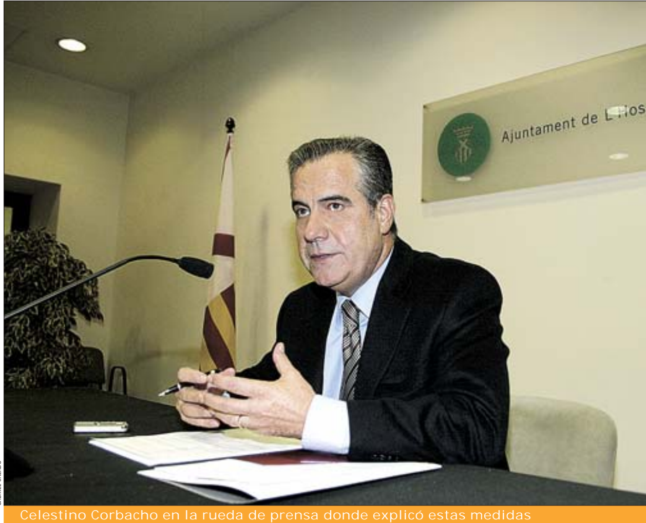
Celestino Corbacho en la rueda de prensa donde explicó estas medidas

El Ayuntamiento ha hecho balance de las actuaciones llevadas a cabo en los últimos meses para que las actividades económicas y los comercios cumplan la normativa