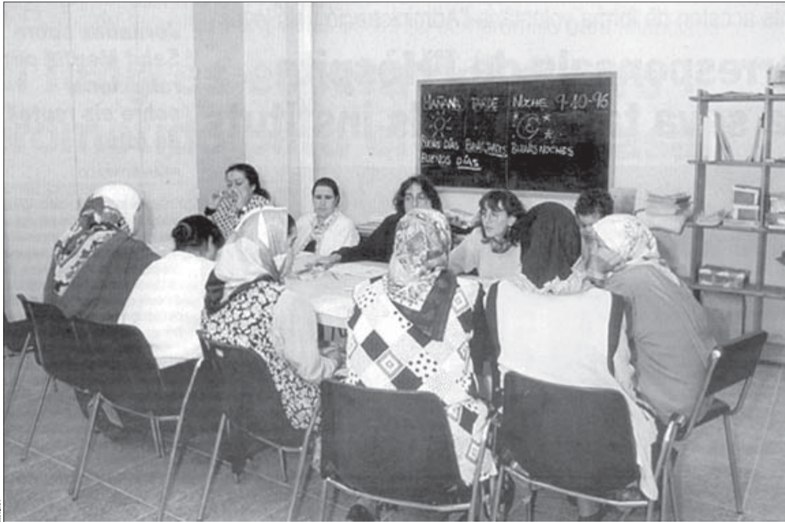
Entre les tasques que es planteja Akwaba, com a entitat solidària, és ajudar els immigrants que arriben al nostre país