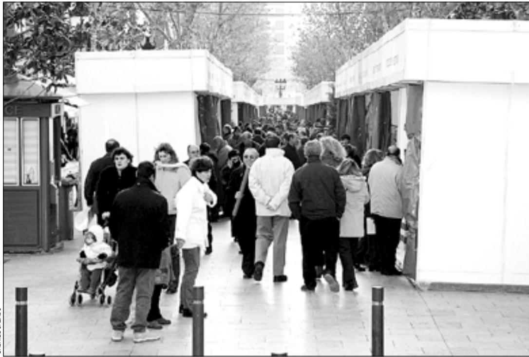
Imatge de la IV edició de la fira a la rambla de Just Oliveras

L'edició d'enguany es dedica a l'Any Internacional de la Muntanya i per això el Club Muntanyenc de LH oferirà dos passis de vídeos de les seves expedicions a la sala d'actes del Districte I. També les entitats desenvoluparan activitats per a les quals a la rambla s'instal·laran dues tarimes. Així, el dissabte 14, a les 12h, a la tarima central es farà l'acte inaugural de la fira. En aquests escenaris, també es podrà veure l'actuació de l'Esbart del Ca-