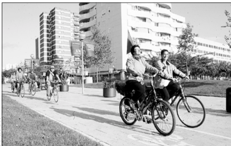
Los ciclistas a su paso por Bellvitge

El sopar es farà el dia 29 al Centre Cultural Collblanc-la Torrassa.