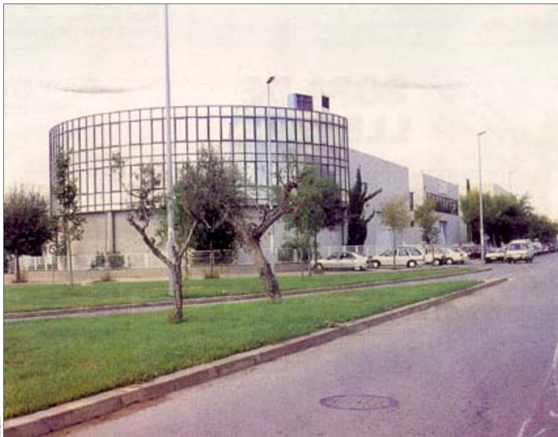
Las empresas apuestan por los polígonos industriales

« L'H se suma al Pacto Industrial para potenciar la actividad económica