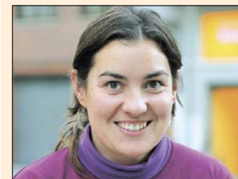
Patricia Codes publicitària

Sens dubte el soroll, perquè penso que és el problema més greu. També sancionaria la consumició d'alcohol a la via pública. En el cas dels menors, però, seria més important fer una tasca de prevenció i educació.