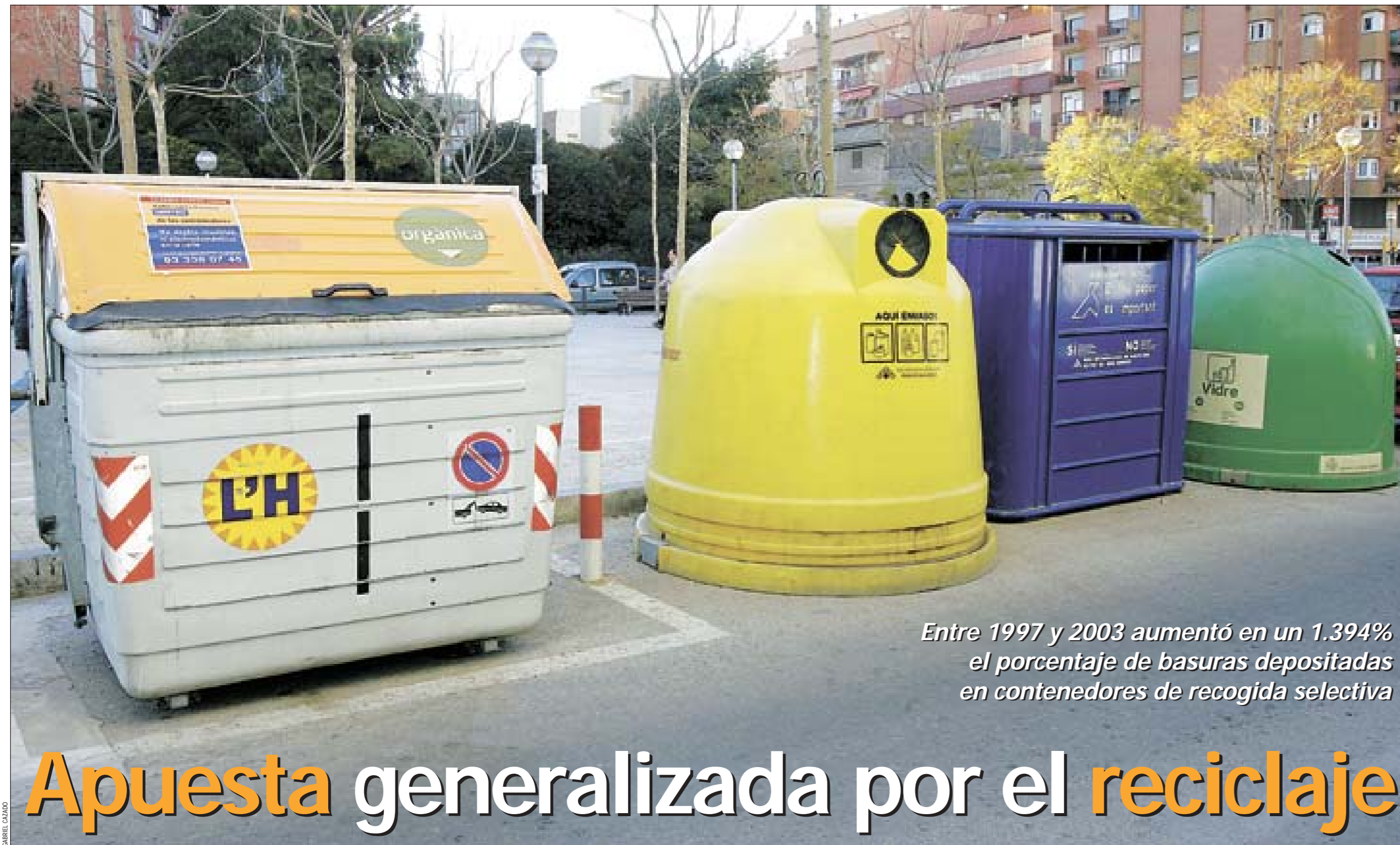
Entre 1997 y 2003 aumentó en un 1.394% el porcentaje de basuras depositadas en contenedores de recogida selectiva