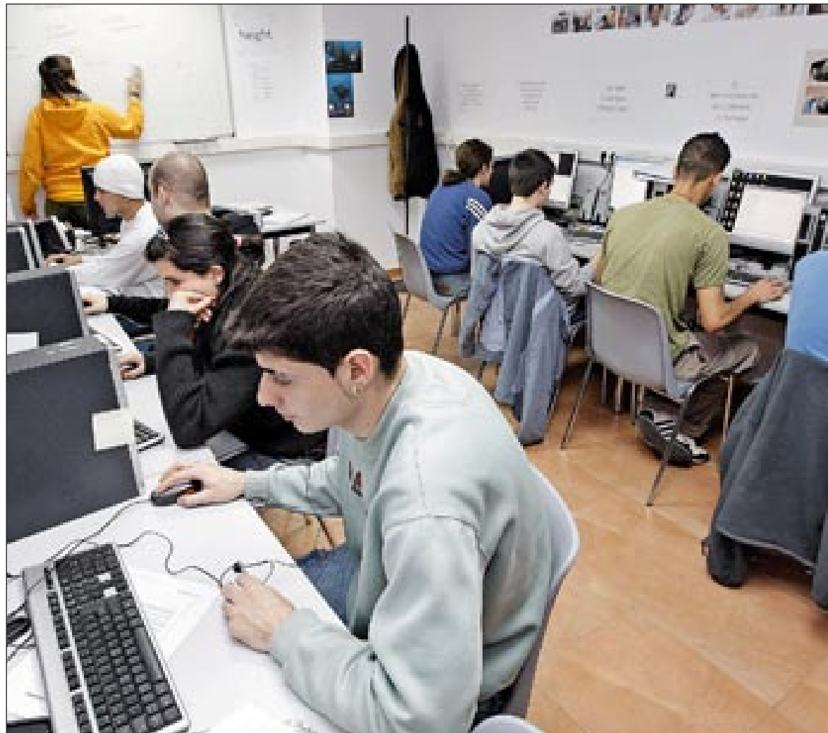
Promoción Económica. A la derecha, los alumnos que asisten a los cursos que se imparten en el Centro de Recursos para la Ocupación

El programa Trabajo en los barrios refuerza los planes integrales con seis iniciativas en Collblanc-la Torrassa y la Florida-Pubilla Cases que se desarrollan en el local de la calle de París