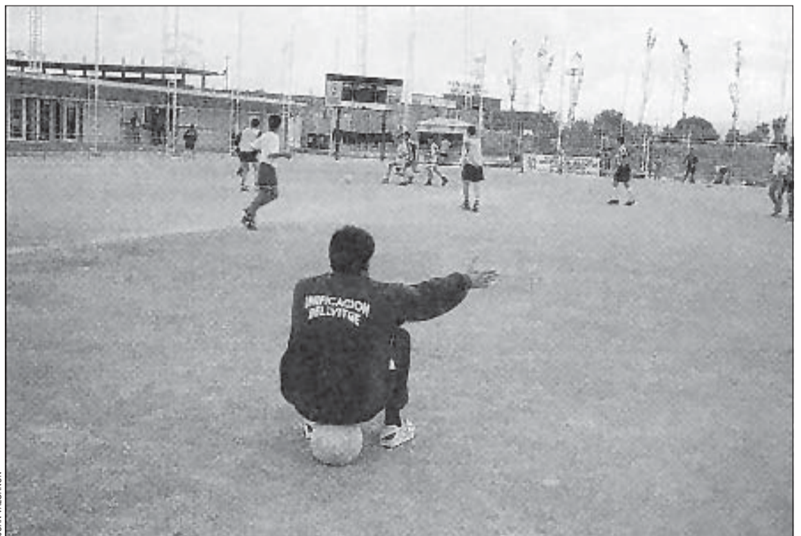
Los jugadores amateur de la Unificación podrán nutrir al primer equipo del Hospi