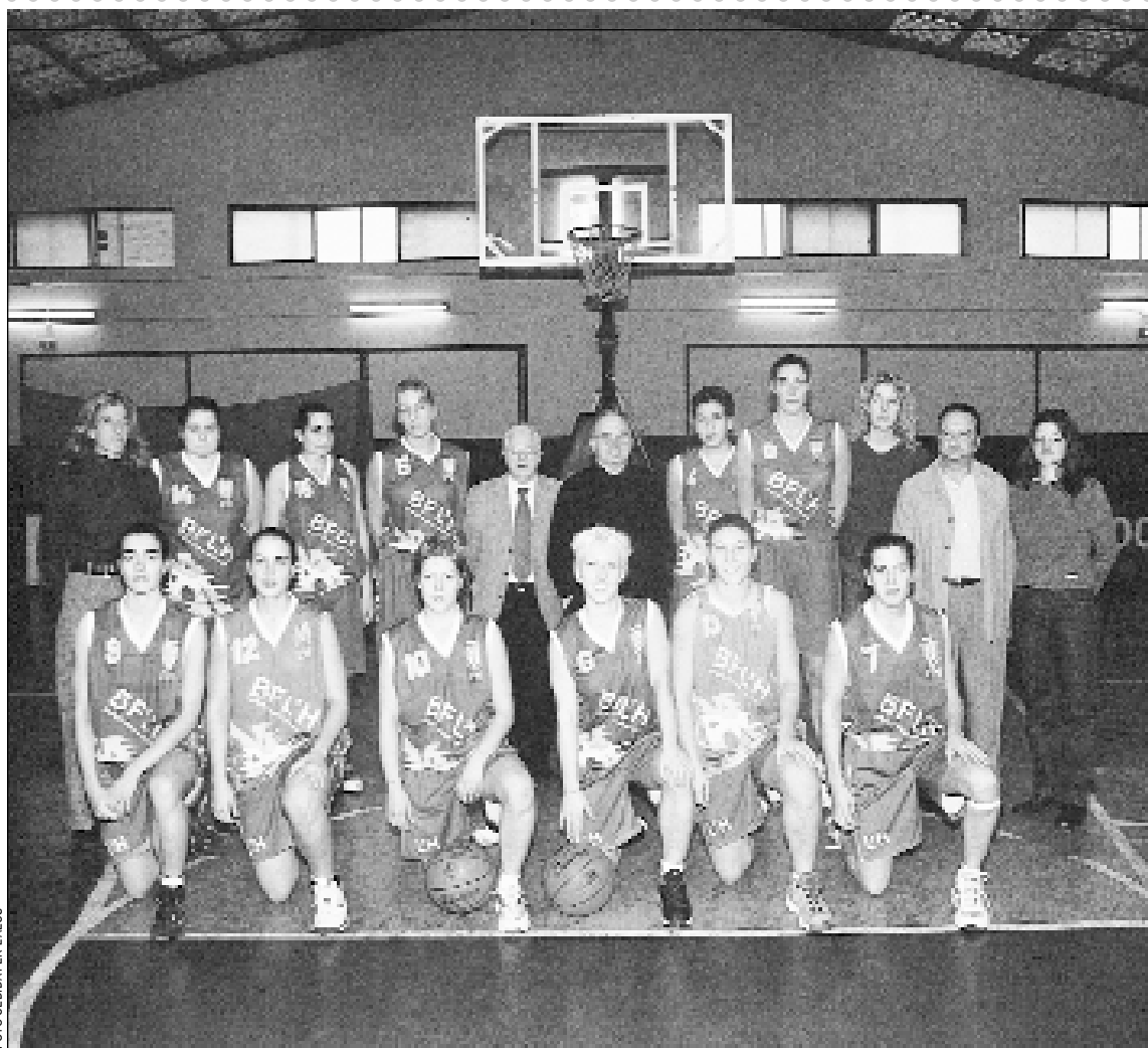
Imagen del equipo senior de la AECS al principio de esta temporada