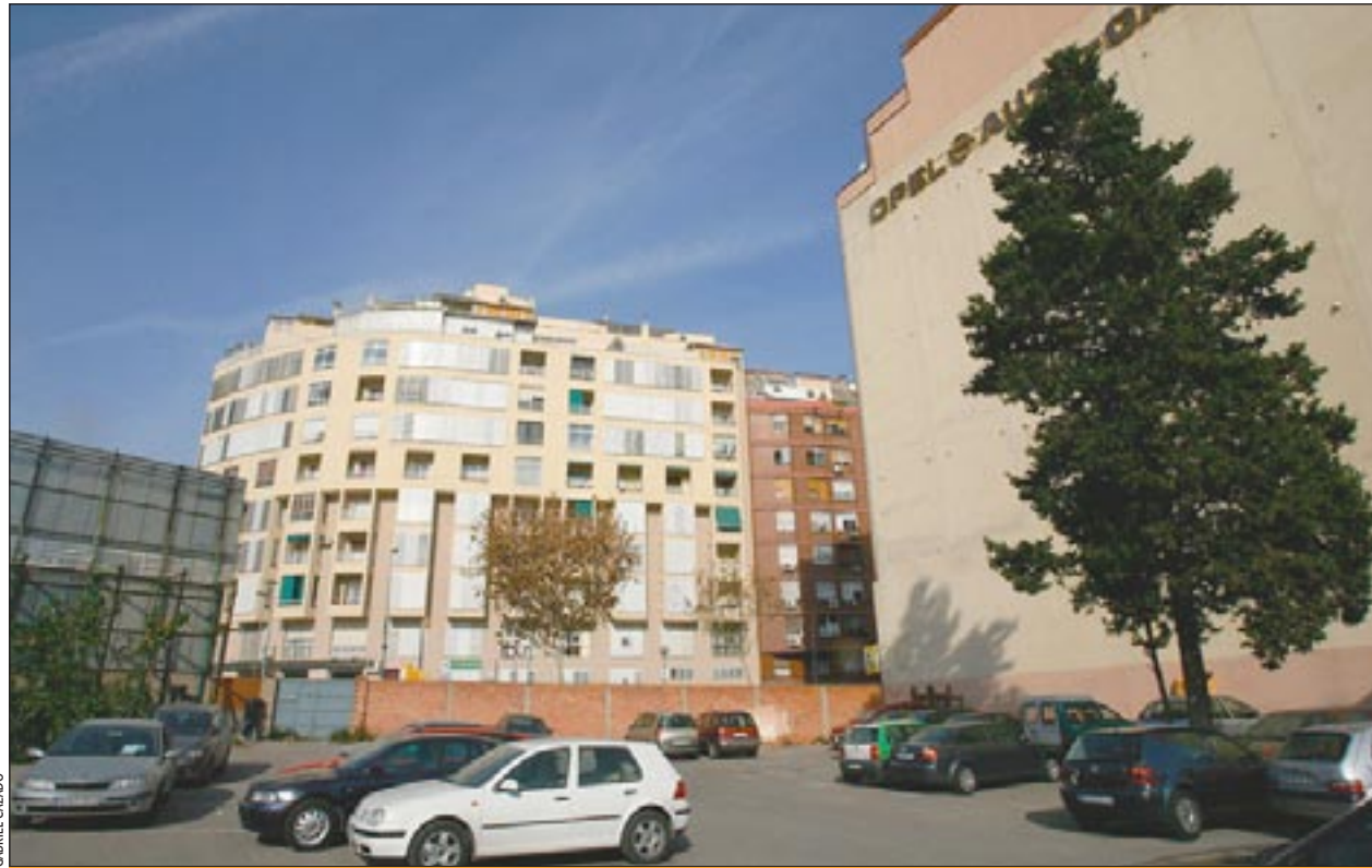
Solar a la cruïlla d'Isabel la Catòlica i Josep Tarradellas on es construiran habitatges

a la part del solar que dona a l'avinguda de Josep Tarradellas, i farà una altra promoció de 30 habitatges, a la façana de l'avinguda d'Isabel la Catòlica, destinats al reallotjament dels afectats per la reordenació urbanística de l'avinguda de Josep Tarradellas. El projecte preveu també la ur-