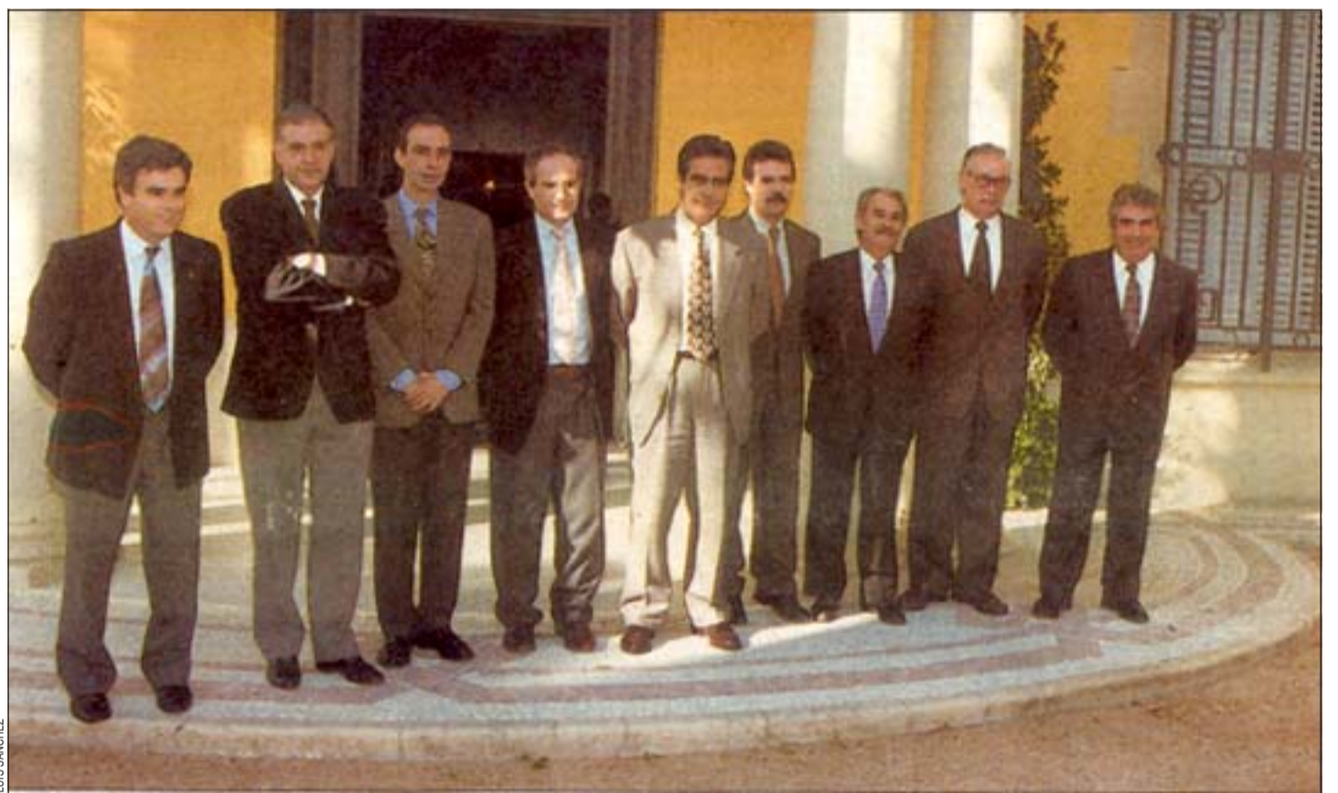
Alcaldes y representantes de empresas firmaron el convenio para hacer realidad la televisión por cable

« El nuevo proyecto televisivo permitirá mejorar la calidad de vida de los ciudadanos