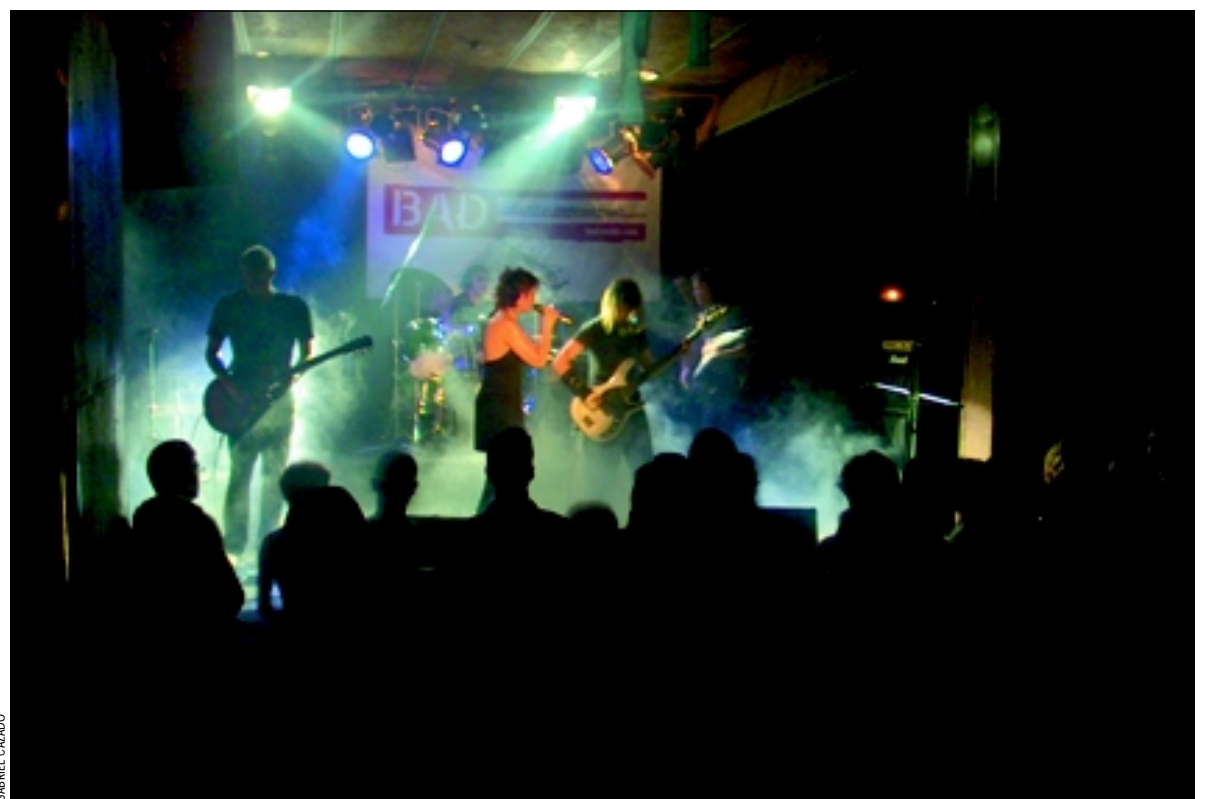
Uno de los conciertos organizados por la Asociación Cultural Bad

La Asociación Cultural Bad tiene su sede social en el Centro Cultural Sanfeliu y está abierta todas las tardes. Actualmente tiene casi 60 socios de entre 17 y 40 años que no pagan ninguna cuota. "Para asociarse a Bad sólo es necesario pertenecer a algún colectivo relacionado con la música pop, como técnico de radio, promotor musical, pertenecer a un sello discográfico indepen-