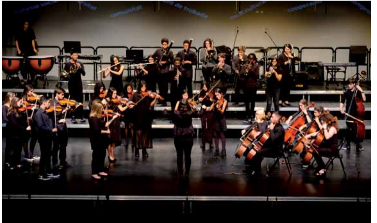
L'orquestra simfònica de l'EMMCA en una actuació el gener passat

artístic i la cohesió social. L'escola va néixer amb els objectius d'incrementar el nombre de persones que practiquen les arts, arribar a nous sectors de població i fer servir les arts com a eina de cohesió i èxit escolar. De fet, a banda dels 900 alumnes amb què compta el centre, també arriba a 900 infants més que fan música, dansa i teatre a la seva escola de primària de la ciutat. ■