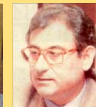
Francisco Castro Empresarios

"Para la Federación de Asociaciones de vecinos supone una inmensa alegría ver que las gestiones municipales han sido efectivas. Ahora estaremos vigilantes para seguir todo el proceso: que el desmantelamiento se lleve a cabo con todas las medidas de seguridad necesarias, que no queden residuos, que la operación se lleve a cabo de una vez. Además, el cierre de la planta permitirá poner a disposición de la ciudad unos terrenos para los que presentaremos nuestras peticiones de servicios".