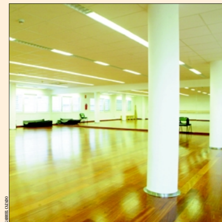
Sala de artes escénicas del CC la Bòbila

La ciudad cuenta con una amplia red de centros y un teatro municipales que fomentan y dinamizan la actividad cultural y artística del municipio con una programación estable de teatro y danza, exposiciones, música y ciclos for-