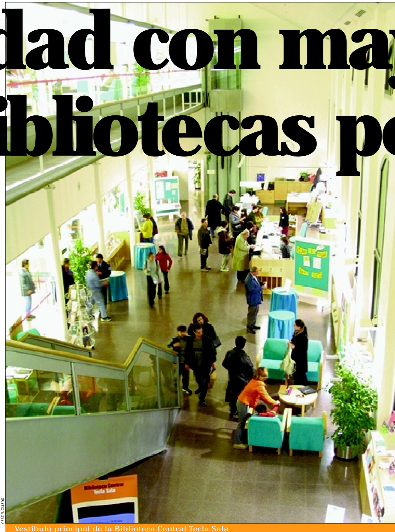
Vestibulo principal de la Biblioteca Central Tecla Sala

El Plan de Bibliotecas de la ciudad sólo está pendiente de acometer la reforma de dos de los equipamientos existentes: las bibliotecas de Santa Eulàlia y Bellvitge. Además, se ha firmado