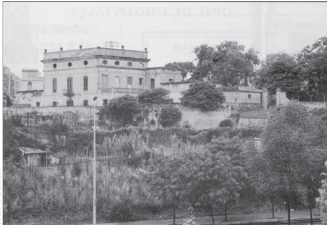
Los terrenos de Can Rigalt están ocupados por huertos ilegales

Para el Consistorio, los recursos municipales deben invertirse primero en espacios más próximos a las zonas residenciales de la ciudad. Durante años, la construcción de zonas verdes ha sido una de las principales reivindicaciones de nuestra ciudad. Por ese motivo, se ha decidido dar prioridad a la construcción de parques como el de Bellvitge, en ejecución, o la Torrassa, que se iniciará en breve, an-