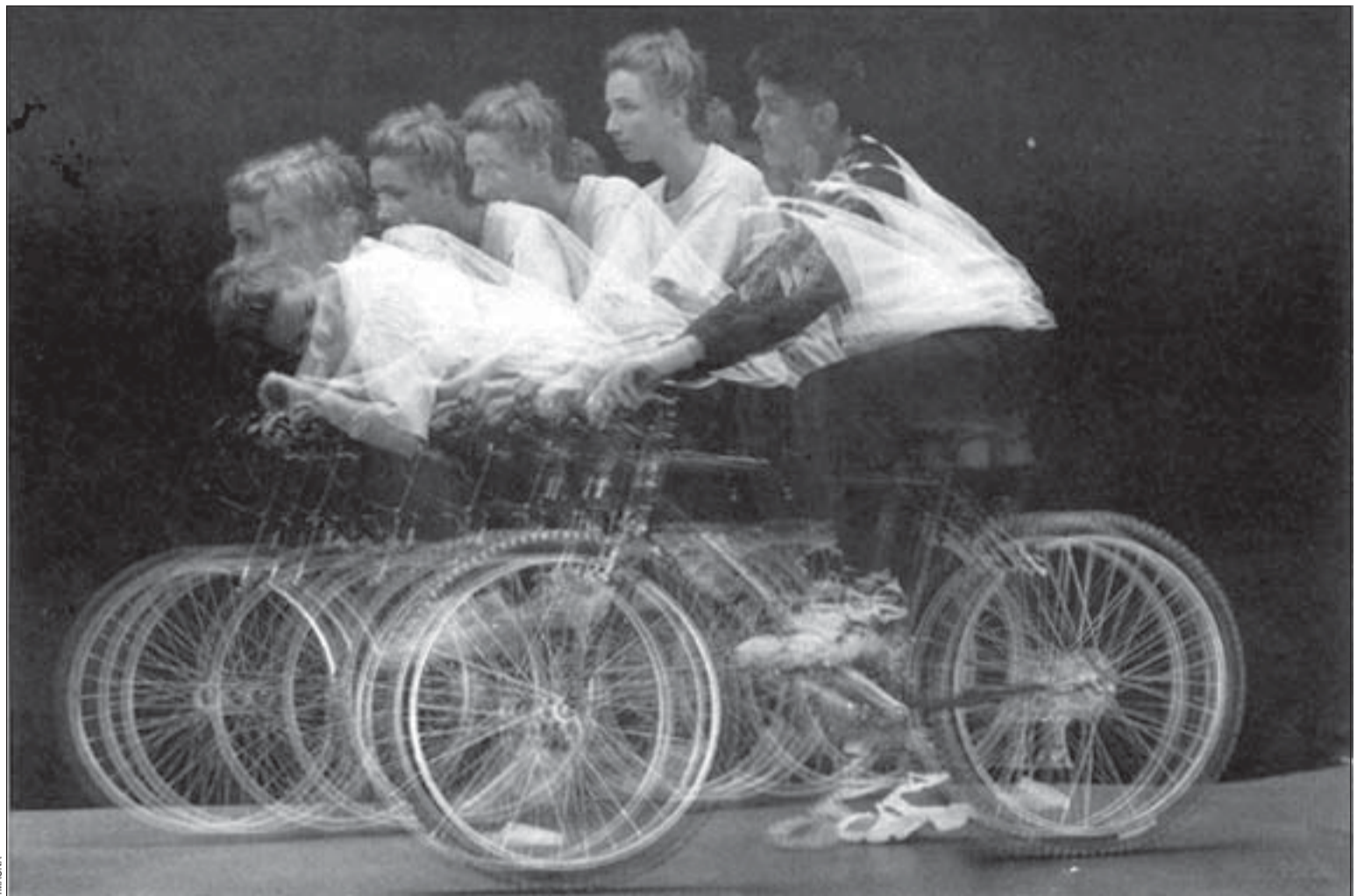
Els hospitalencs estan convidats a passejar en 'bici' per la ciutat el dia 23 d'abril

El mateix dia, però de les 8.30 a les 20 hores i al Complex Esportiu Tennis L'Hospitalet, tindrà lloc el Dia del Tennis. Aquesta diada