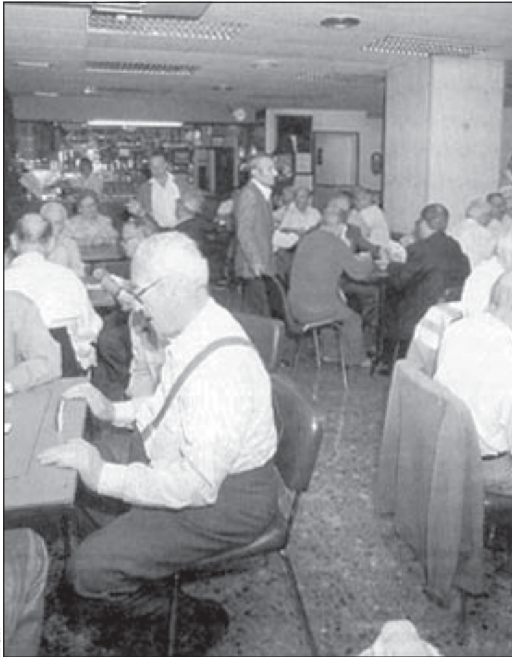
El local que ahora ocupa el Casal Progrés resulta insuficiente

El edificio para el casal tendrá 1.900 metros cuadrados edificables, con tres pisos de altura, que dispondrá de una sala polivalente con capacidad para 270 personas, dos aulas-taller, una sala de lectura, espacios para peluquería y podología, gimnasio y gestión y servicios generales de la entidad.