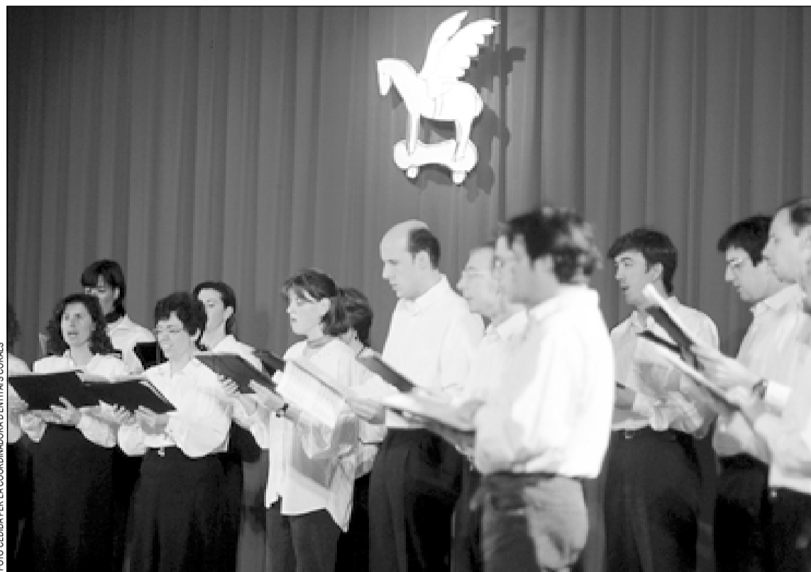
La Setmana de Cant Coral persegueix difondre la música polifònica entre tots els públics