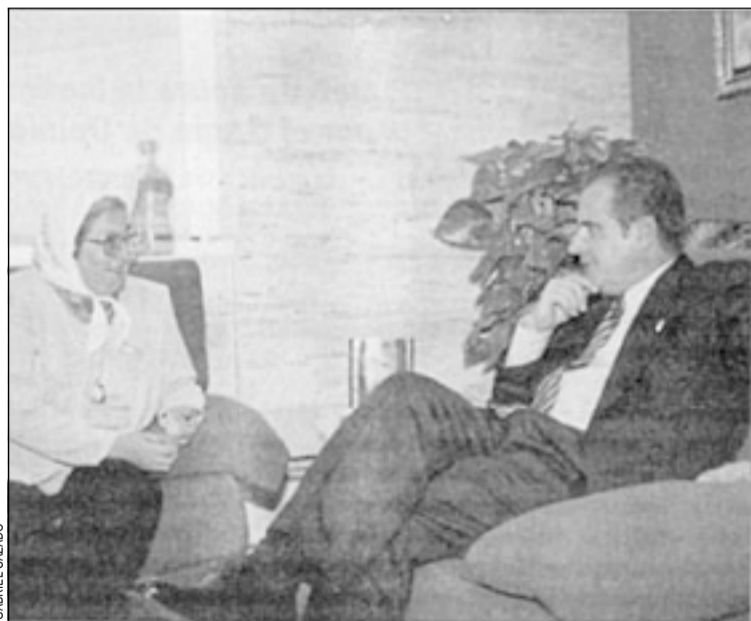
Hebe de Bonafini va ser rebuda per l'alcalde Corbacho

El Consell Municipal de Cooperació, integrat per entitats i l'Ajuntament, i encarregat de proposar a on i a què destinar els recursos de la ciutat per a la solidaritat, estudiarà el projecte i dissenyarà