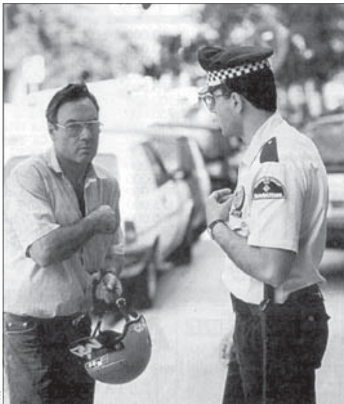
La policía municipal es uno de los cuerpos más valorados

La Encuesta de Seguridad Ciudadana otorga una buena puntuación a los cuerpos de seguridad, que superan el aprobado y los resultados obtenidos en encuestas anteriores. La Policía Nacional obtiene un 6,38, seguida de la Guardia Urbana, con 6,16, y de los Mossos d'Esquadra, 5,96. También los Servicios Sociales cuentan con la confianza de los ciudadanos que les otorgan una puntuación de 6,06 puntos. La política de seguridad del Ayuntamiento es la más valorada, con 5,73 puntos. La Generalitat se sitúa en segundo lugar, con 5,71 puntos, y el Gobierno central en tercero, con 5,16.