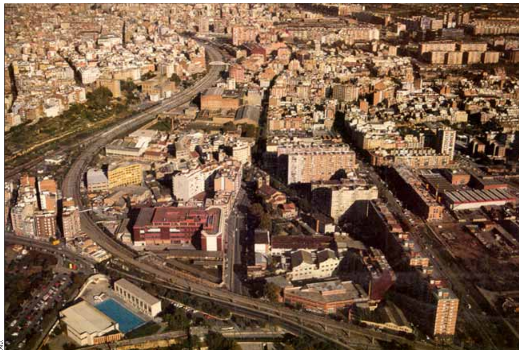
Las líneas de Renfe que ahora dividen L'Hospitalet se cuestionan en el proyecto de ciudad unida que se propone para el siglo XXI

Una de las primeras propuestas de este documento es convertir un territorio ahora fragmentado en una ciudad unitaria gracias a la supresión de las barreras físicas que suponen las infraestructuras viarias y diseñando una red viaria coherente que conecte la ciudad con el exterior y todos sus barrios entre sí. Dos son las grandes barreras que ahora dividen L'Hospitalet: las vías de Renfe y la Gran Vía. En el primer caso se plantea mejorar los pasos que cruzan la línea de Vilafranca y soterrar un tramo de la línea de Vilanova, con el fin de salvar el actual cruce entre las dos líneas. Por lo