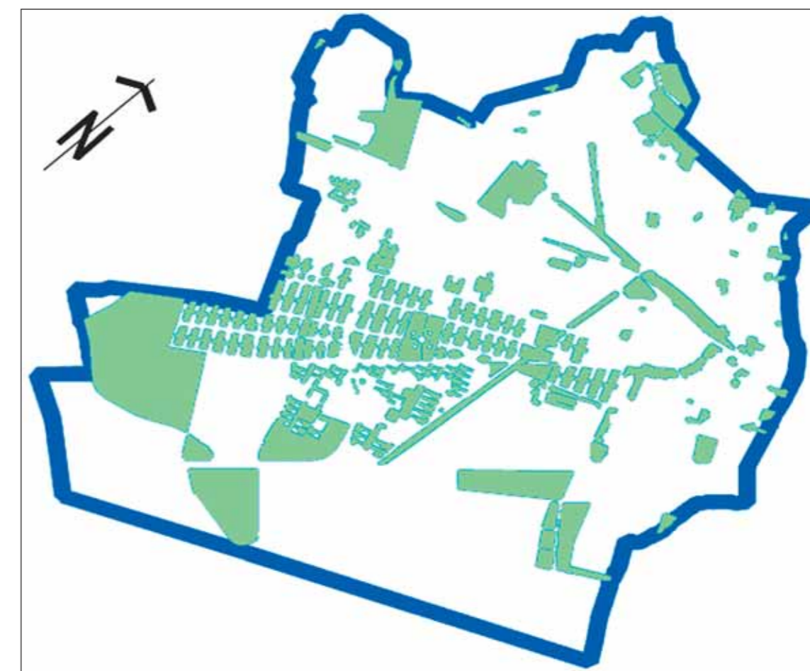
El objetivo para el 2010 es que haya 5 metros cuadrados de zona verde por habitante