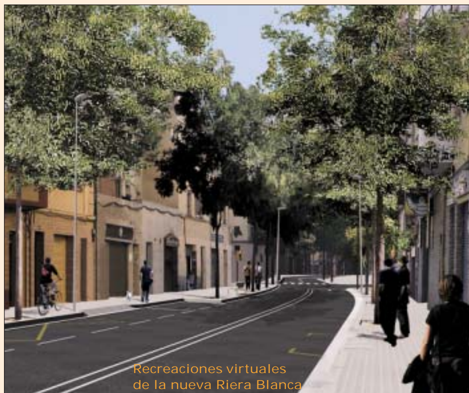
Recreaciones virtuales de la nueva Riera Blanca