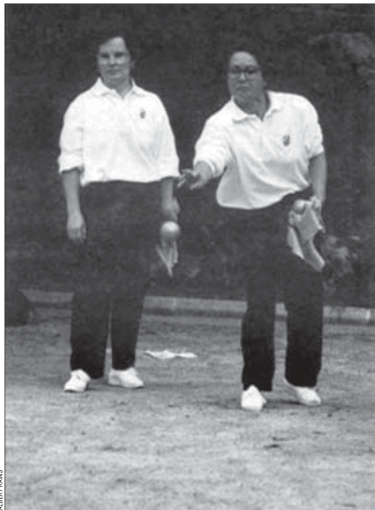
La temporada catalana de petanca no ha sido brillante