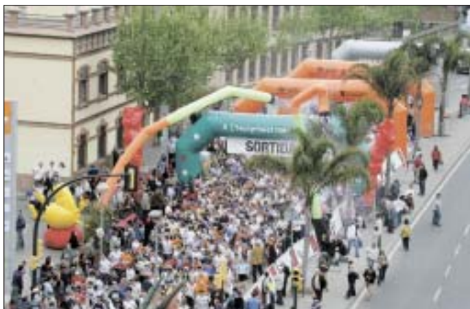
Centenars d'atletes van recórrer els 5 quilòmetres de circuit urbà de la cursa popular. Sortida i meta a Josep Tarradellas