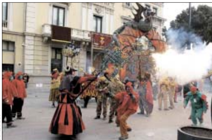
Els cinc correfocs organitzats per 80 colles de diables infantils dels Països Catalans van confluïr a la plaça de l'Ajuntament