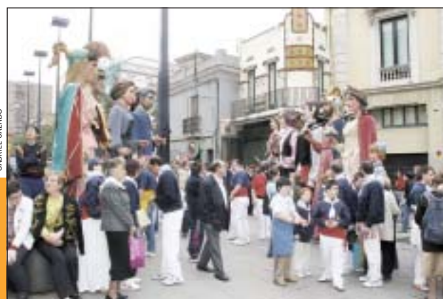
La tradicional plantada gegantera, que ha celebrat la 18a edició, va servir de marc per commemorar els 20 anys dels gegants de Sant Josep

Manolo García, Bunbury, Niña Pastori i Chambao (a les imatges de la dreta) van encapçalar el programa musical de les festes. Tots quatre concerts van tenir com a escenari La Farga