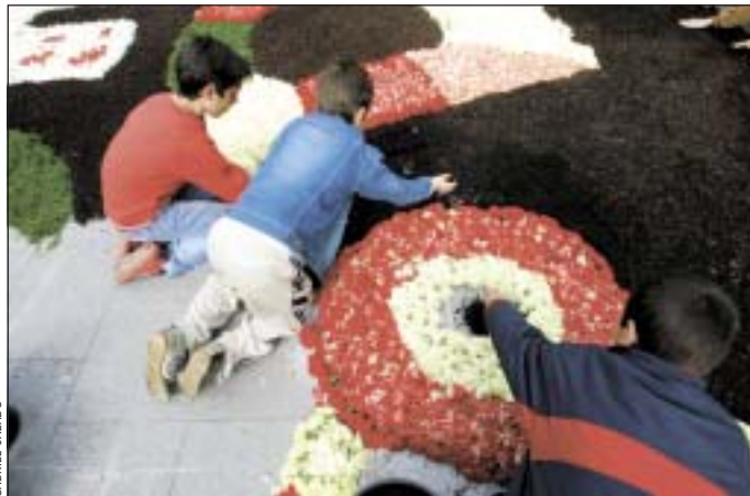
Escolars i entitats van participar en el muntatge de cinc catifes florals a la Florida, Centre, Bellvitge, Collblanc i Sant Eulàlia