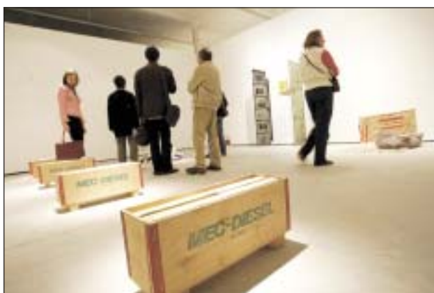
Un dels plats forts del programa, la mostra d'artistes locals presentada sota el títol Estances de la metàfora romandrà a la Tecla fins al 15 de juny