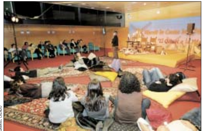
El Quixot ha estat el protagonista de la Marató de Contes que va tenir lloc a les biblioteques. Imatge de la lectura a la Tecla Sala